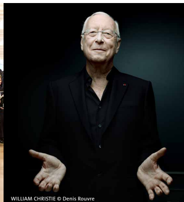
WILLIAM CHRISTIE