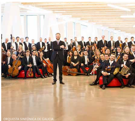
ORQUESTA SINFÓNICA DE GALICIA